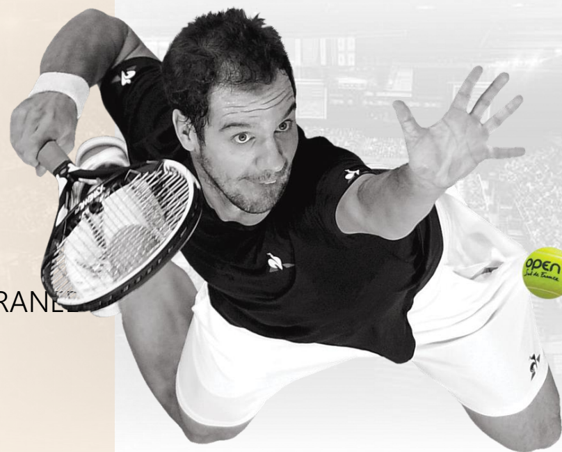
Richard GASQUET : vainqueur 2013 / 2015 /2016